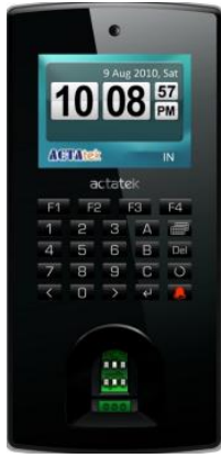
جهاز نظام بصمة (actatek)