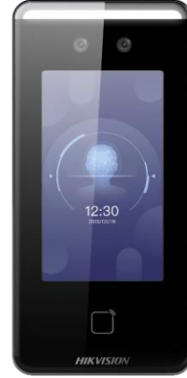
جهاز نظام بصمة الوجه