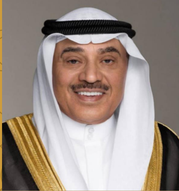
سمو الشيخ صباح خالد الحمد الصباح ولي عهد دولة الكويت