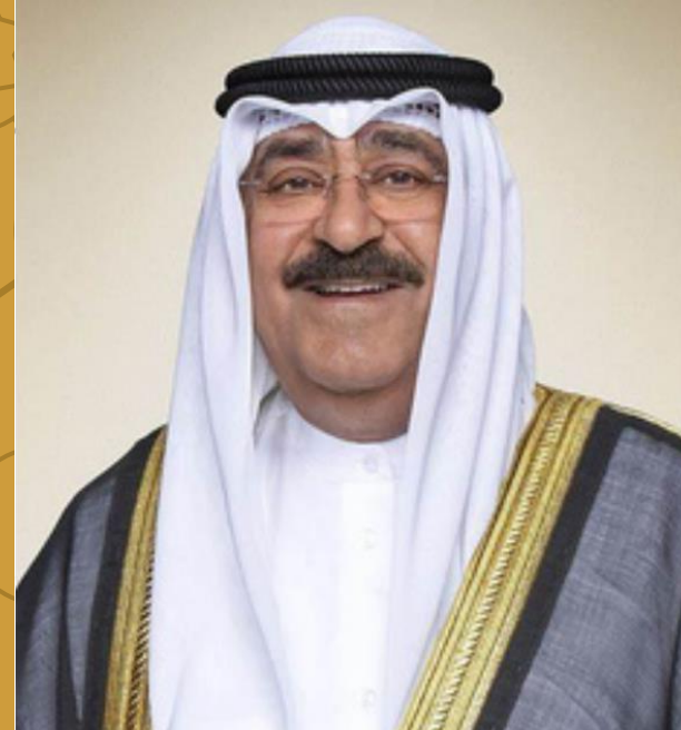
صاحب السمو الشيخ مشعل الاحمد الجابر الصباح أمير دولة الكويت